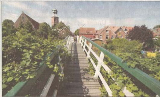
Ditzum ist immer eine Reise wert. Besonders, wenn das Hafenfest mit Kunsthandwerk- und Bauernmarkt geboten wird.

Für nur 50 Cent pro Gast fährt an beiden Tagen, im stündlichen Rhythmus, die Ditzum-Petkum-Fähre.