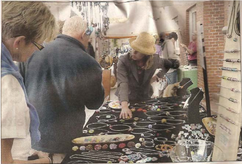
Schmuckarbeiten aus Naturprodukten werden beim Handwerkermarkt in Ditzum angeboten.