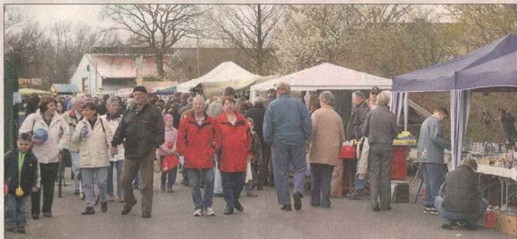
Die Geschäftswelt sowie die Vereine und Organisationen in Hesel laden am Sonntag, 18. März, erneut zum großen Erlebnistag ein.

Neben den interessanten Aktionen der örtlichen Firmen werden auch Getränke- und Verzehrstände sowie ein großer Trödel- und Flohmarkt auf die Besucher warten. Der Großteil der Geschäfte in Hesel öffnen die Türen an