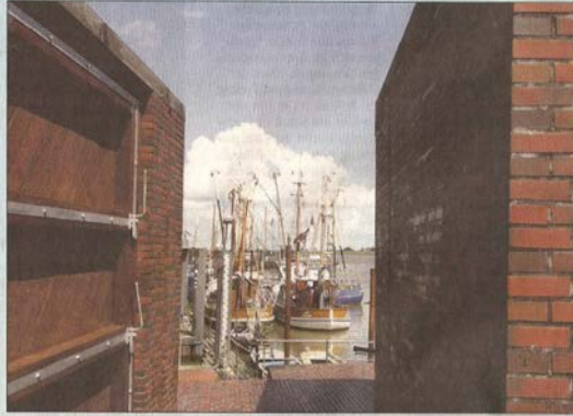
Stets ein Blickfang: Der Hafen von Ditzum. Hier herrscht am 24. und 25. Juli ein lebendiges Treiben - und von hieraus starten auch die Kutter zu ihrer Regatta.

Ein besonderes Angebot haben die Ditzumer, die sich allesamt mit dem Fest